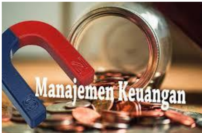
Gambar 1.1 Manajemen Keuangan

Arti dari manajemen keuangan adalah bagaimana perusahaan mendapatkan uang dari hasil usahanya baik dari jasa, dagang maupun produksi tentunya dalam penggunaan dan pengalokasian dana yang di di gunakan haruslah melalui perhitungan yang matang dan mengutamakan efisien guna memaksimalkan nilai perusahaan.