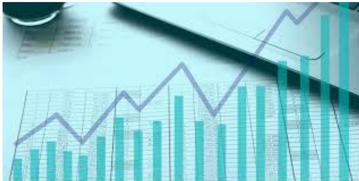
Gambar 2.1 Analisa Laporan Keuangan

Analisa laporan keuangan adalah metode yang perlu dilakukan perusahaan guna menguji kualitas dari laporan keuangan, secara cermat dan baik oleh Karena itu dalam menganalisa laporan keuangan perlu melakukan berbagai macam metode yang tepat dan cermat agar hasil dari analisa tersebut sesuai dengan keinginan ataupun harapan dari perusahaan yang berguna sebagai bahan pertimbangan perusahaan untuk mengambil keputusan yang strategis serta menyangkut masa depan perusahaan. Karena dari hasil analisa keuangan yang dilakukan oleh akuntan tentang keadaan perusahaan ataupun kondisi kekuatan perusahaan berkaitan dengan laporan keuangan dalam hal ini dapat memperoleh keuntungan atau laba yang diharapkan perusahaan, catatan perlu di perhatikan bahwa kinerja